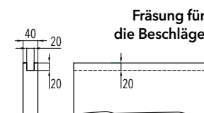
Fräsung für die Beschläge

Zur Aufnahme der Beschläge ist oben am Türblatt eine Fräsung auszuführen. An der Türblattunterseite wird eine Nut für die Bodenführung eingearbeitet. (siehe Abbildungen)